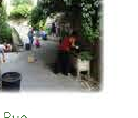
Jardin des Eaux Chaudes