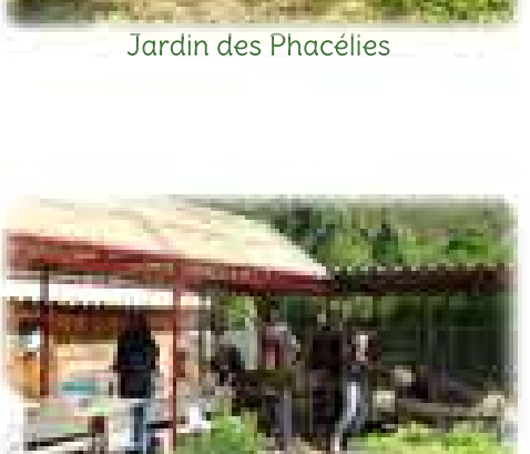
Jardin des Phacélies